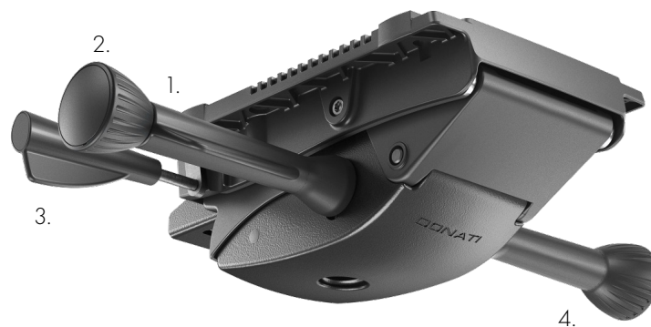
Mehhanismi tüüp SWF1+T1

Sünkroonse kiiksüsteemi (istme ja seljatoe koos kallutamine) jäikuse reguleerimiseks keerake istme all paremal oleva hoova otsas asuvat nuppu (2) päri- või vastupäeva. Reguleerige kiiksüsteem vastavalt oma kehakaalule.